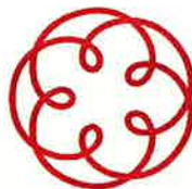
Consiglio Nazionale dei Dottori Commercialisti e degli Esperti Contabili